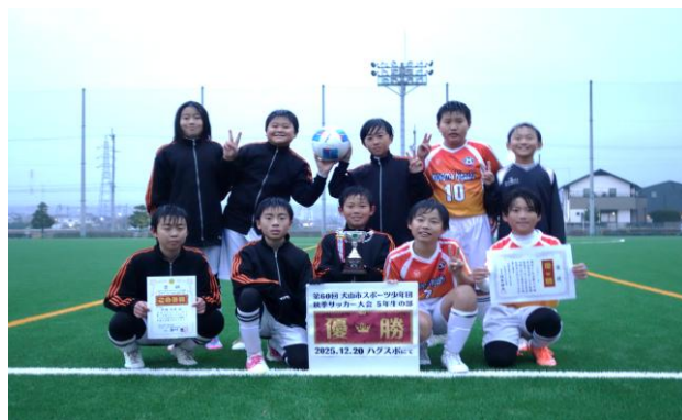
犬山東フットボールクラブ